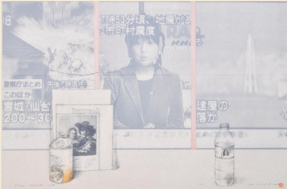
《日記：2011年3月12日（1/8）》，2011年，木版畫，油印機-絲印，54.5 x 85.1 厘米。